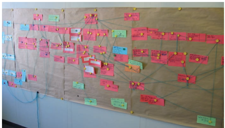
Abb. 2: Eine fortgeschriebene Architekturvision.

Die Architekturvision sollte die Architektur der jeweils nächsten Produktversion skizzieren. Schließlich gilt in Scrum das agile Mantra: Die einzige Konstante ist